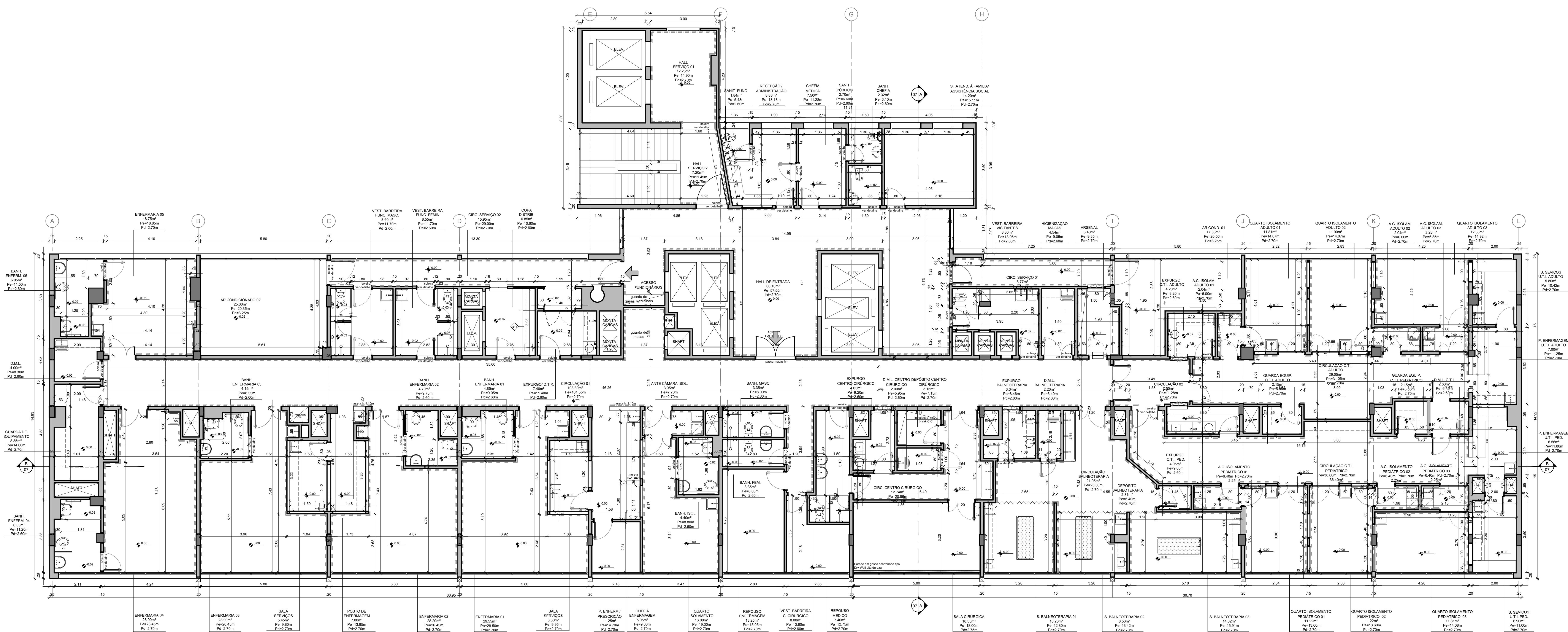
02 PLANTA ARQUITETURA ESCALA 1/75