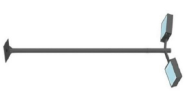
Poste com Luminária LED