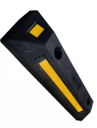
Limitador de Vaga